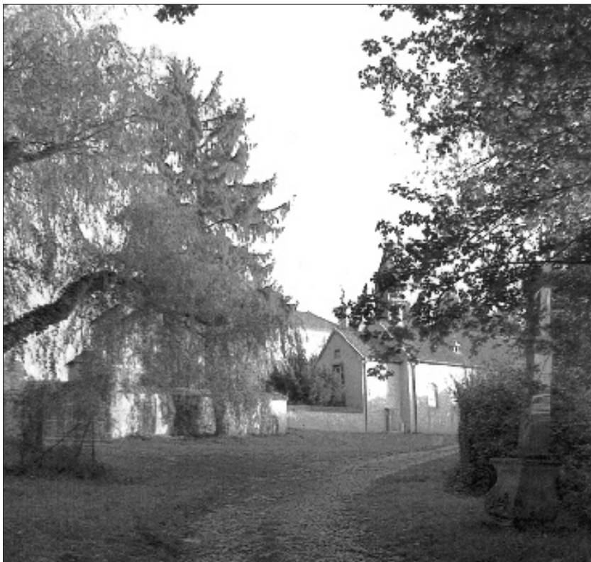
Le Couvent, Centre International des Chemins du Baroque